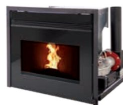
Noir RAL 9005

Insert à granulés : un rail coulissant permet de remplir le réservoir de granulés.