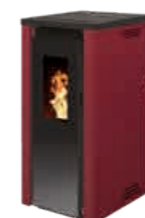
Bordeaux - RAL 3004