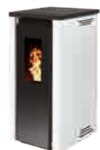
Blanc - RAL 9003