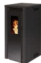
Noir - RAL 9005