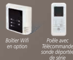
Poêle avec Télécommande sonde déportée de série