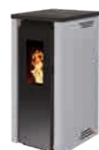
Gris - RAL 9023